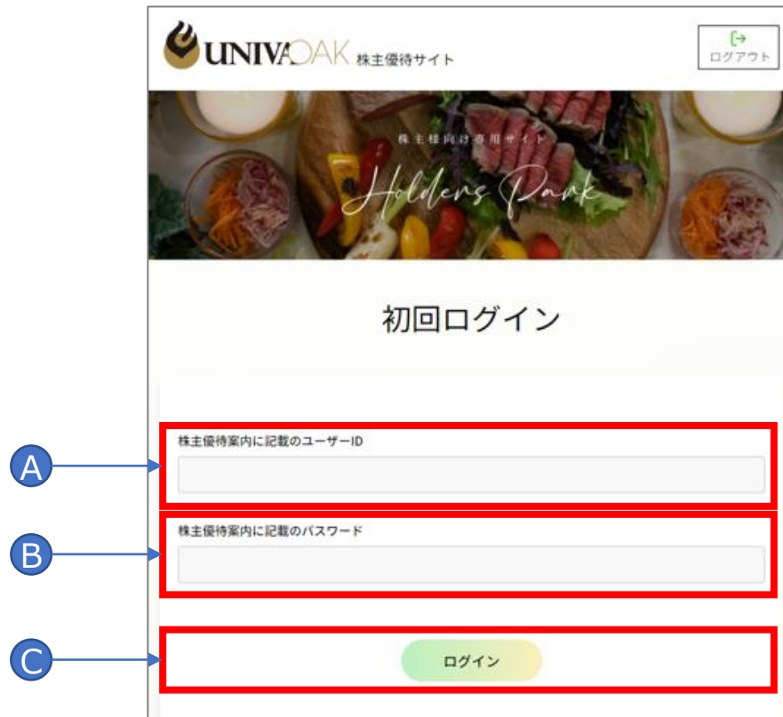
UNIVA・Oak株主優待サイト画像