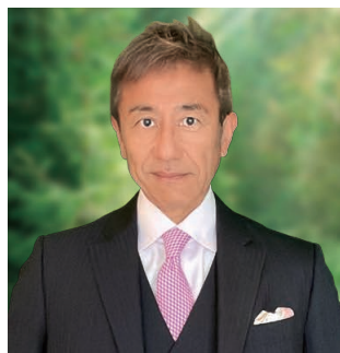
代表取締役会長兼社長 グループCEO